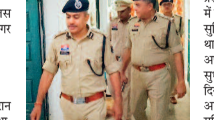
कार्यप्रणाली की विस्तृत समीक्षा करते हुए शाखा प्रभारियों को आवश्यक दिशा-