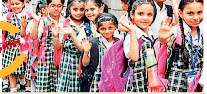
दुर्ग जिले में 1427 सीटों के लिए 1055 बच्चों का चयन