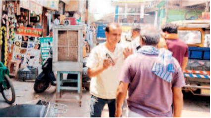
अत्यंत व्यस्त मार्ग है, जहां प्रतिदिन बड़ी संख्या में वाहनों का आवागमन होता है। ऐसे में सड़क पर अतिक्रमण से आम नागरिकों को भारी असुविधा का सामना करना पड़ता है। नगर निगम ने नागरिकों एवं व्यापारियों से अपील की है कि वे यातायात व्यवस्था बनाए रखने में सहयोग करें और सड़क पर अतिक्रमण न करें, ताकि शहर को सुरक्षित एवं व्यवस्थित बनाया जा सके।

भिलाई। नगर पालिक निगम भिलाई द्वारा शहर में यातायात व्यवस्था को सुचारू बनाने एवं सड़कों को अतिक्रमण मुक्त रखने के उद्देश्य से पावर हाउस चौक पर दूसरे दिन भी सख्त कार्रवाई की गई। निगम की टीम ने उन व्यापारियों एवं ठेला संचालकों पर कार्रवाई की, जो सड़क के बीचों-बीच सामान रखकर या फल-तेला लगाकर व्यवसाय कर रहे थे। ऐसे अतिक्रमण के कारण मार्ग अवरुद्ध हो रहा था, जिससे आए दिन जाम की स्थिति बनती है और दुर्घटना की आशंका बढ़ जाती है। कार्रवाई के दौरान निगम अमले ने सड़क पर रखे सामान को हटवाया तथा संबंधित लोगों को सख्त हिदायत दी गई कि वे निर्धारित स्थानों पर ही अपना व्यवसाय करें। साथ ही चेतावनी दी गई कि भविष्य में पुनः अतिक्रमण पाए जाने पर जुर्माना एवं कड़ी कार्रवाई की जाएगी। निगम अधिकारियों ने बताया कि पावर हाउस चौक शहर का